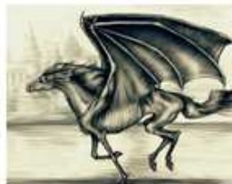
CAVALLO ALATO - THESTRAL